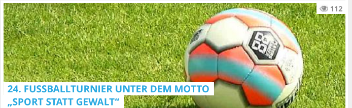
24. FUSSBALLTURNIER UNTER DEM MOTTO „SPORT STATT GEWALT“