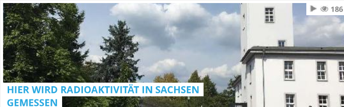
HIER WIRD RADIOAKTIVITÄT IN SACHSEN GEMESSEN