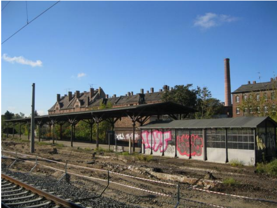
Der alte Bahnsteigabgang des Bahnhofs Plagwitz.

In Plagwitz werden ehrenamtliche Handwerker gesucht: Sei es zum Dach abdecken, Scheiben entfernen, Niete ziehen, aber auch zur leiblichen Versorgung der Helfer: Das Ziel des aktuellen Projektes der Stiftung "Ecken wecken" ist die Rettung der so genannten Stahleinhausung des alten Bahnsteigabganges am Bahnhof Plagwitz.