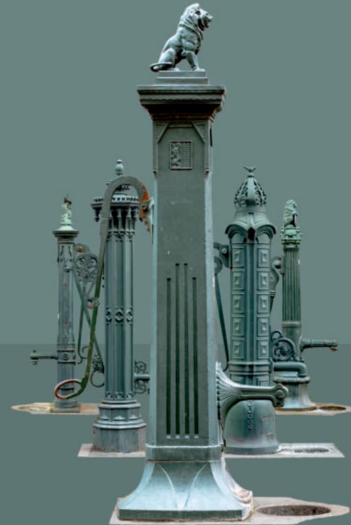
GESTALTUNG UND FOTOS: MARCUS KORZER FOTOGRAFIE

Karte mit Innenstadtrundgang zur Ausstellung im Stadtbüro