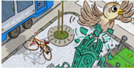
Grafik: Anton Balzun